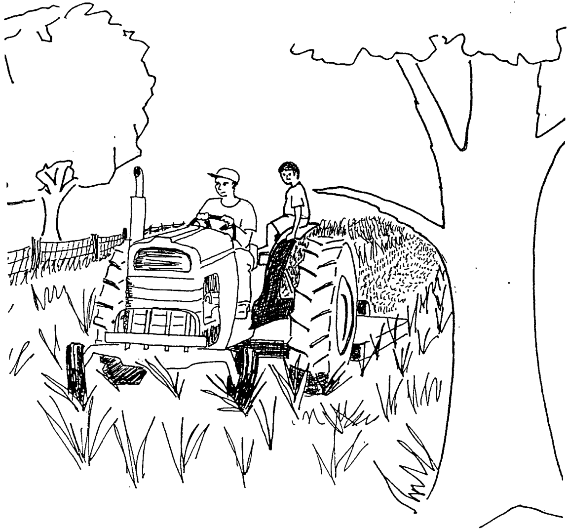
Figura 2: Antonio continúa su subida peligrosa.