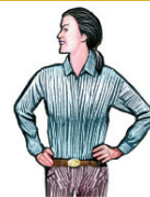
No ropa suelta o pelo suelto