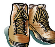
No use zapatos que resbalen