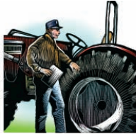
Inspección de seguridad