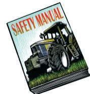
Entrenamientos de seguridad