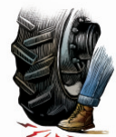
Daños físicos producidos por el tractor