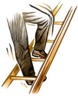
Risk of Falling