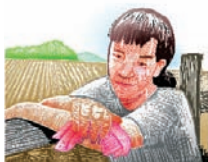
Estrés causado por el calor