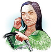
Manejando de modo descuidado