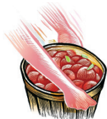
Levantamiento de objetos pesados