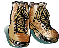
Zapatos que no resbalen