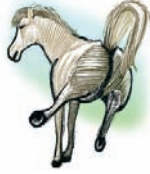
Patadas de animales