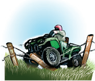
Collision with Obstacles