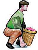
Movimientos apropiados del cuerpo