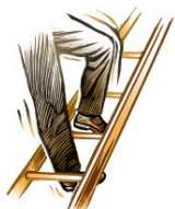
Riesgos de caídas