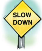
Reduzca la velocidad