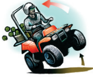
Volcamiento de vehículos