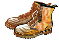
Zapatos con protección de metal