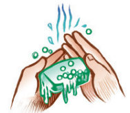
Buenas prácticas higiénicas de las manos