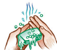
Buenas prácticas higiénicas de las manos