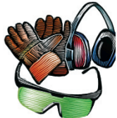
Equipo de protección personal