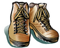
No utilice zapatos que resbalen