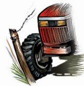
Atropellamiento por tractores