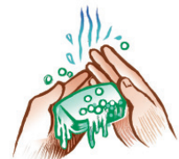
Buenas prácticas higiénicas de las manos