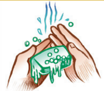
Buenas prácticas higiénicas de las manos