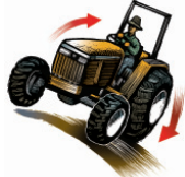
Volcamiento del tractor