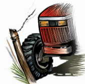
Collision with Obstacles