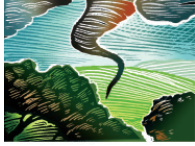
Sun, Heat and Severe Weather