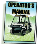
Entrenamiento de seguridad